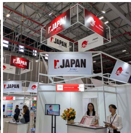
前回(2025年)の ジャパン・パビリオンの様子